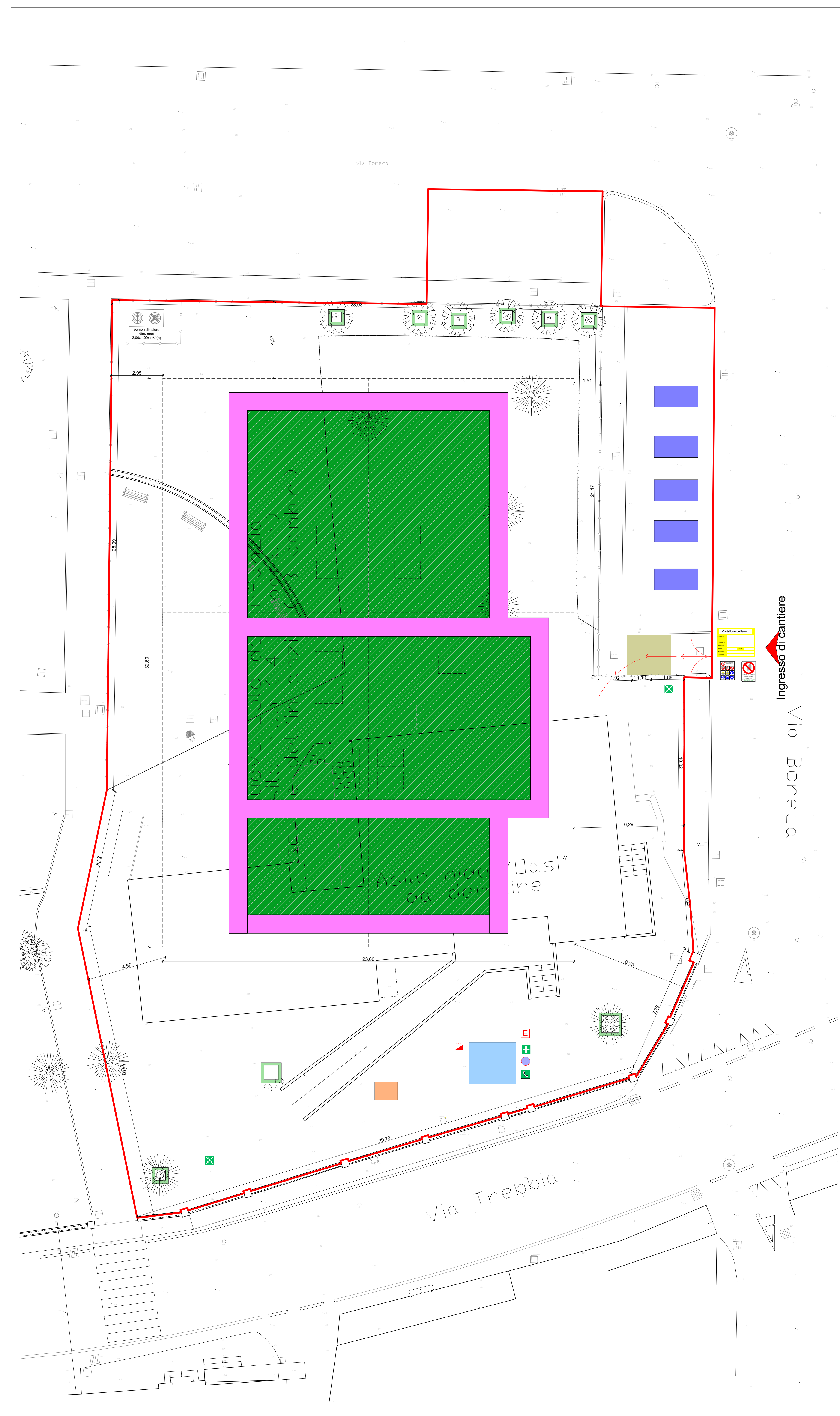
Layout di cantiere - Fase 02